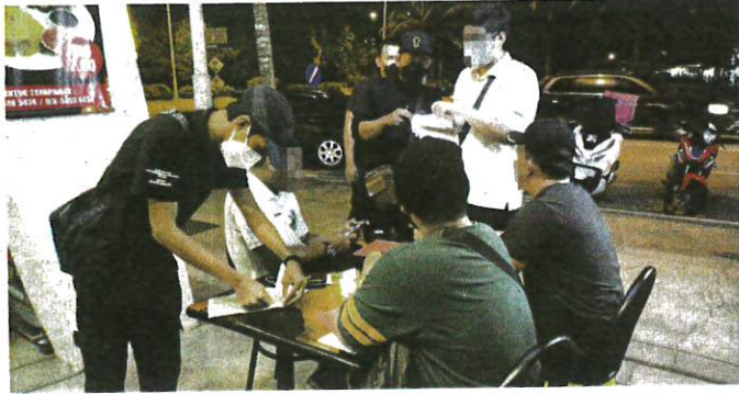
PEGAWAI penguat kuasa mengeluarkan notis kesalahan kepada perokok menerusi Operasi Bersepadu di sekitar Putrajaya, kelmarin.

Operasi bermula jam 8 malam dilakukan Kementerian Kesihatan Mala-