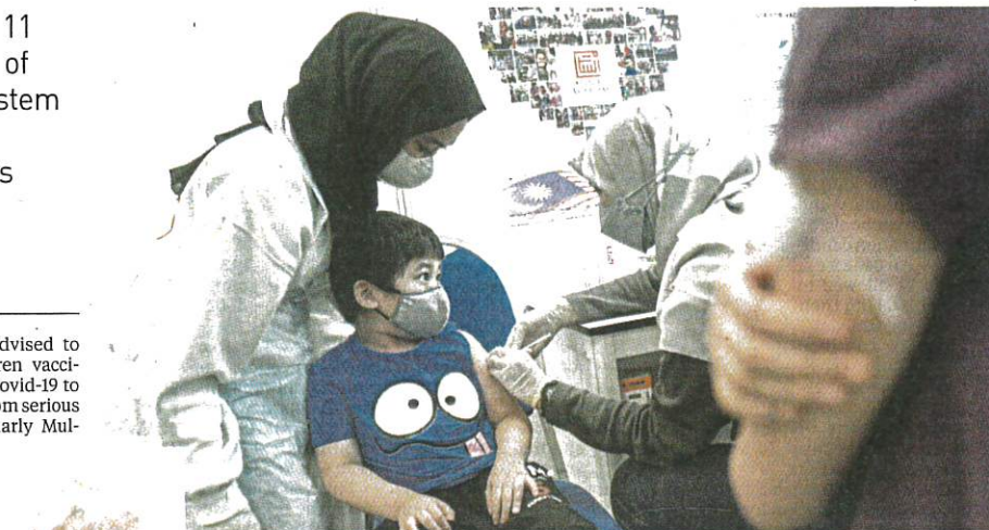
A child sitting still as a health worker administers a Covid-19 vaccine at the Axiata Arena vaccination centre in Bukit Jalil yesterday.

He said the study found seven deaths resulting from MIS-C, or four per cent of cases.