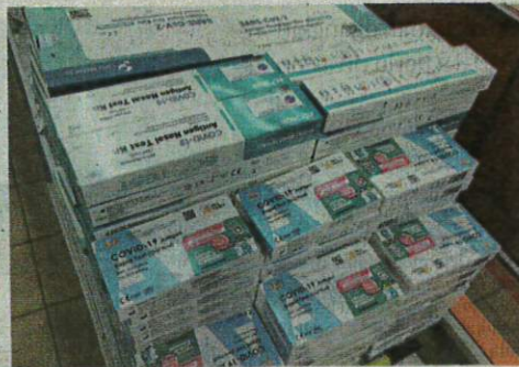
Bekalan kit ujian sendiri Covid-19 jenis calitan air liur di farmasi didapati terhad sejak Tahun Baharu Cina.

Ahli farmasi lain, Yee Wei Pheng turut menghadapi masalah kekurangan stok kit ujian sendiri Covid-19 tersebut sejak kebelakangan ini.