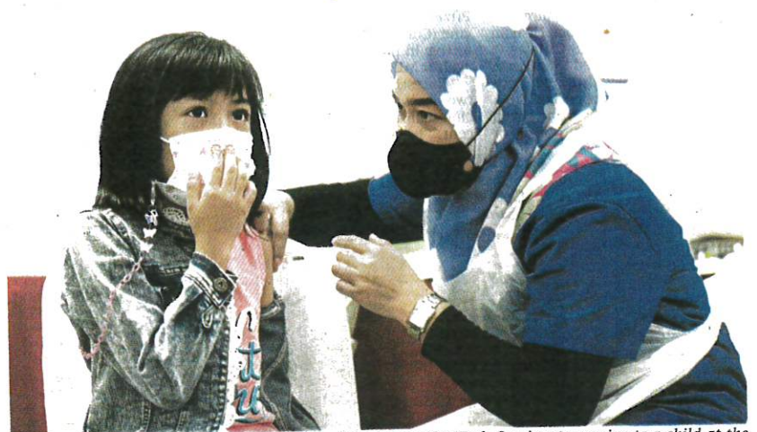
A health worker administering the first dose of the Pfizer-BioNTech Comirnaty vaccine to a child at the Sungai Nibong vaccination centre in George Town, Penang, yesterday.