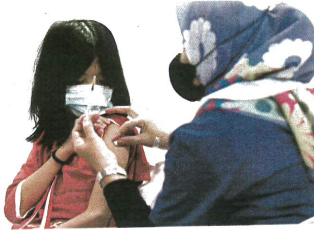
A health worker administering a Covid-19 vaccine at the Tapak Pesta vaccination centre in Sungai Nibong yesterday.

AKHBAR : NEW STRAITS TIMES MUKA SURAT : 2 RUANGAN : NEWS / STORY OF THE DAY