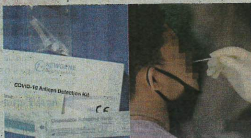
Pekerja yang didapati memanipulasi keputusan RTK mereka boleh dikenakan tindakan mengikut Akta Kerja 1955.

"Jika memang disahkan pekerja ambil kesempatan untuk cuti, maka boleh diambil tindakan. Tiada masalah untuk