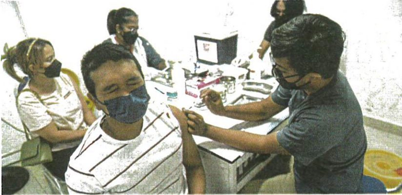
Penerima dos penggalak di Pusat Pemberian Vaksin (PPV) Axiata Arena, Bukit Jalil, semalam.