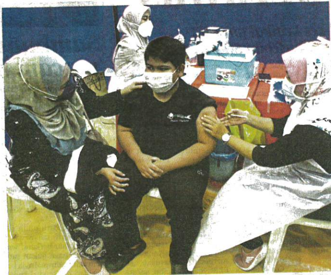
STAF kesihatan memberikan suntikan vaksin Covid-19 kepada seorang kanak-kanak di Dewan Serbaguna, Projek Perumahan Rakyat (PPR) Padang Hilliran, Kuala Terengganu.

secara langsung akibat pandemik Covid-19 yang mengganggu kehidupan keluarga serta aspek sosial mereka.