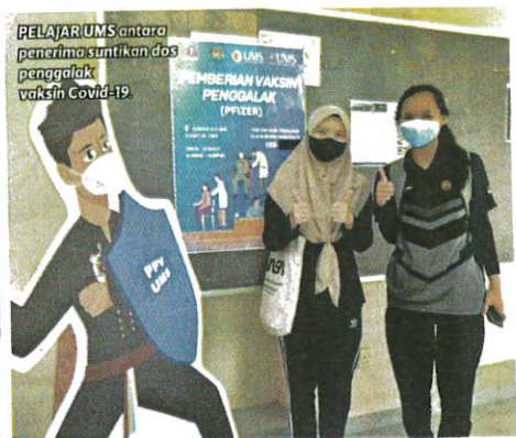
PELAJAR UMS antara penerima suntikan dos penggalak vaksin Covid-19.