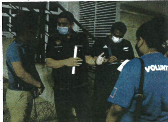
Pegawai kesihatan mengeluarkan kompaun kepada individu yang merokok di premis makanan pada operasi di sekitar Presint 8 Putrajaya, malam kelmarin.

"Hasil pemeriksaan, 15 pelanggan menerima notis kesalahan mengikut Peraturan 11 Peraturan-Peraturan Kawalan Hasil Tembakau (PPKHT) 2004. "Bagaimanapun, tiada kom-