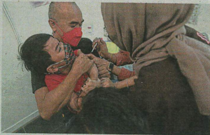
No pain, no gain: A father consoling his son while he receives his vaccine at the Axiata Arena vaccination centre at Bukit Jalil.

Inflammatory Syndrome in Children (MIS-C) was a serious condition that could affect children infected with Covid-19.