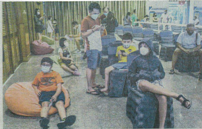
Children waiting for their Covid jabs at the World Trade Centre Kuala Lumpur yesterday.

AKHBAR : THE SUN ON THURSDAY MUKA SURAT : 4 RUANGAN : NEWS WITHOUT BORDERS