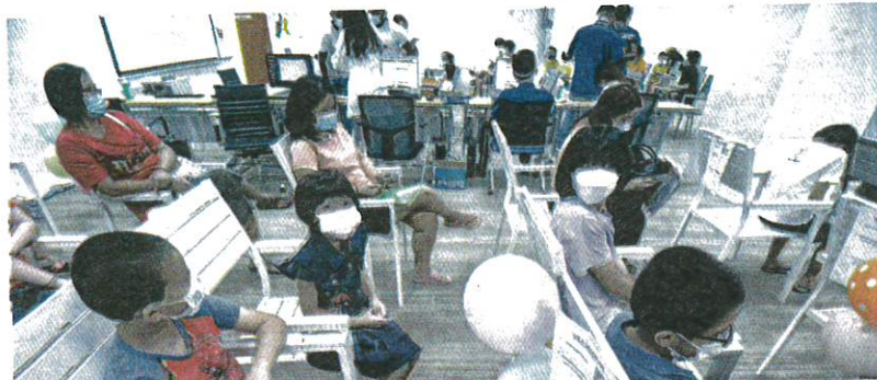
SEBAHAGIAN kanak-kanak menunggu giliran untuk menerima vaksin Covid-19 menerusi PICKids di Hospital UCSI, Port Dickson, Negeri Sembilan, kelmarin.

"Kepada ibu bapa ini, MMA menasihatkan mereka untuk bercakap sama ada dengan pakar pediatrik atau doktor keluarga mereka untuk mendapatkan maklumat yang sahih sebelum membuat keputusan untuk memberi vaksin kepada