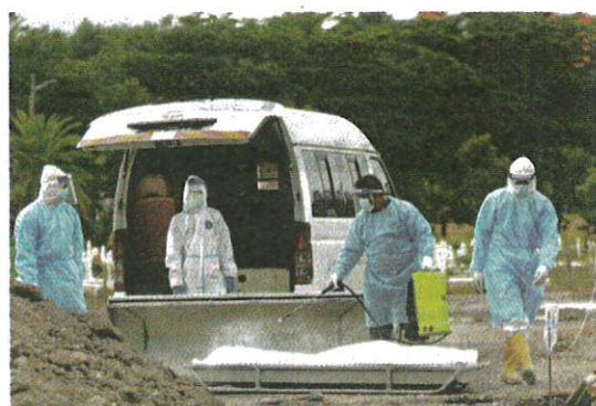
PETUGAS kesihatan menguruskan jenazah pesakit Covid-19 di Tanah Perkuburan Islam Seksyen 21, Shah Alam baru-baru ini.

"Seterusnya, 48 kes (50.53 peratus) mempunyai komorbid dan tiada kes ibu mengandung. Dilaporkan sembilan kes (0.03 peratus daripada kes semalam)