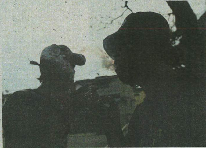
No more puffing: The government plans to introduce a new law banning smoking, including vaping for those born after 2005. Picture posed by models.

As for vaping devices, he said any electronic items in the country must be approved by the board and any liquid substances also must be approved by the Health Ministry.